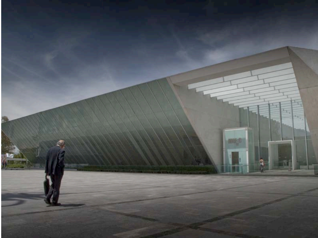
MUAC, Museo Universitario de Arte Contemporáneo. UNAM, Cd.