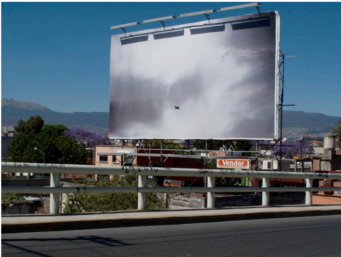
Félix González-Torres. Vista de instalación exterior, MUAC, Cd. México, 2010

Hace unos días 1 , dirigiéndome hacia alguna parte de la Ciudad de México, me llamó la atención un espectacular ubicado en el Eje 7 y Calzada de Tlalpan, porque no contenía ningún mensaje publicitario. Pensé: “al rato le ponen el logo del producto y la leyenda de invitación, sugerencia o mandato de compra”, pero cuál fue mi sorpresa que, al visitar el Museo Universitario Arte Contemporáneo MUAC que se encuentra en la Ciudad Universitaria al sur del Distrito Federal, me volví a topar con él; de esta forma conocí el motivo de la existencia de este espectacular. Era parte de la exposición de un cubano llamado Félix González-Torres denominada Somewhere / Nowhere (Algún lugar / Ningún lugar).