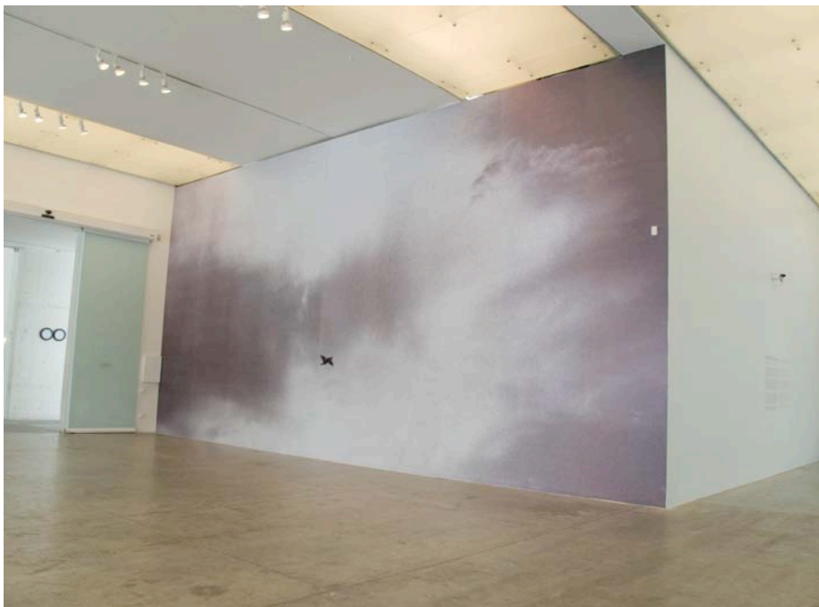
Félix González-Torres. Vista de instalación interior, MUAC, Cd. México,

Mi interés por esta imagen creció al descubrir, en otra pared de la exposición, una serie titulada “Untitled”, 1994, constituida por cuatro fotografías 2 ordenadas horizontalmente de forma lineal con la misma temática del espectacular; por esta razón, presento la instalación del espectacular, la instalación en el museo y la secuencia de las cuatro imágenes fotográficas.