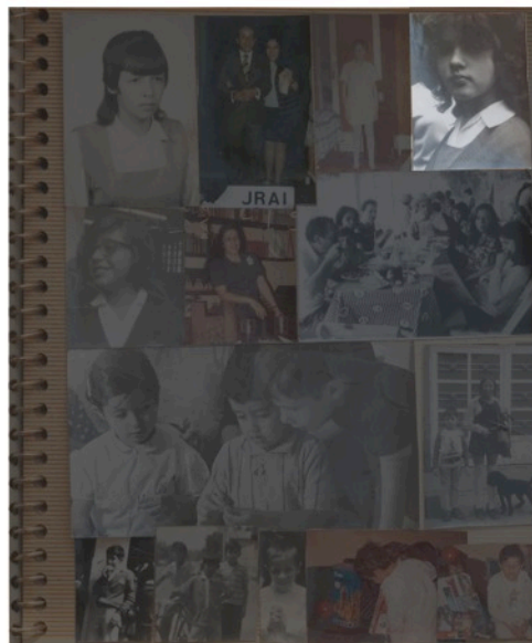
Álbum familiar # 4 (arriba) GS en color, esquina superior derecha. (abajo) GS en blanco y negro, esquina superior derecha México, D.F., 1971