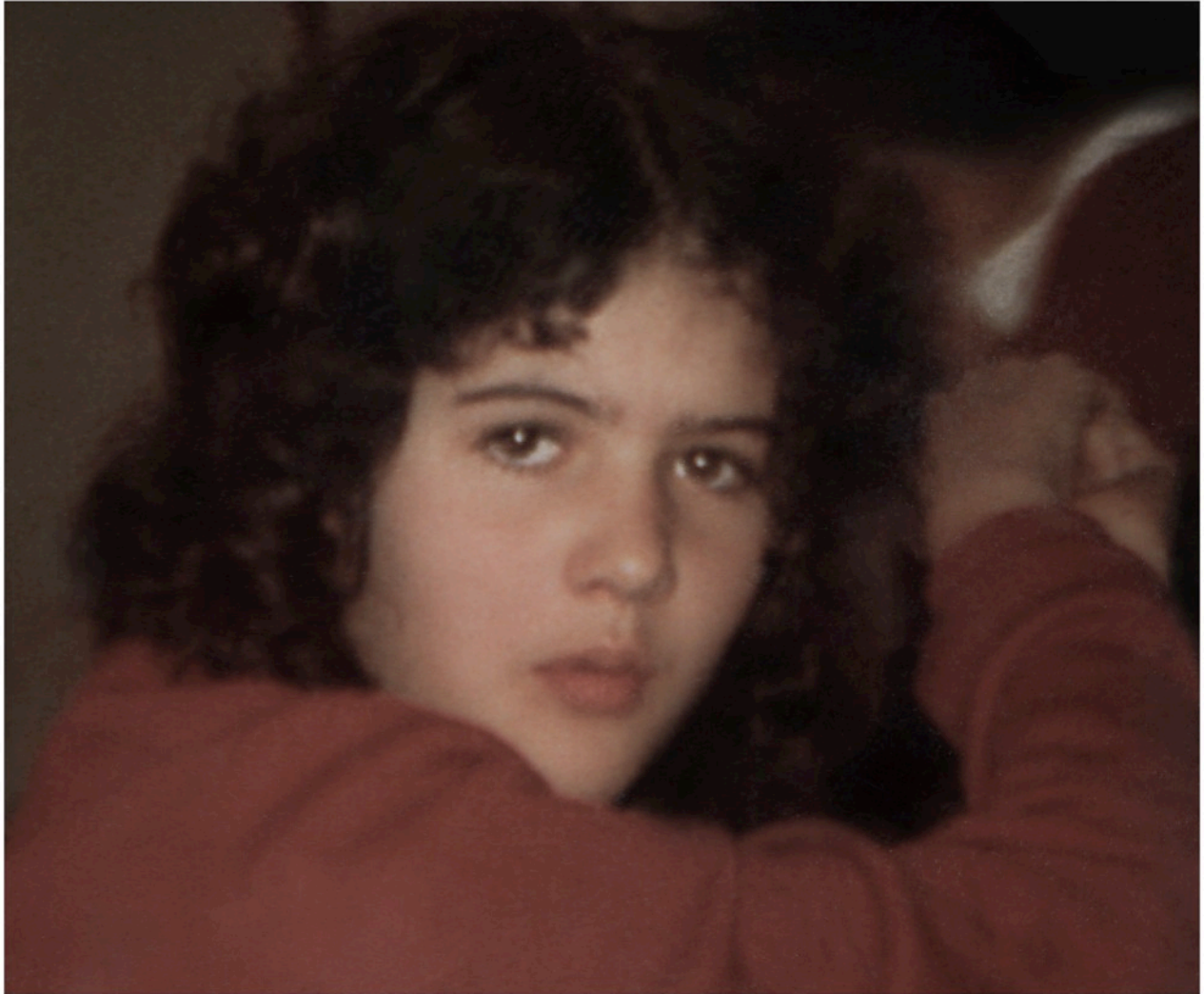
GS en color