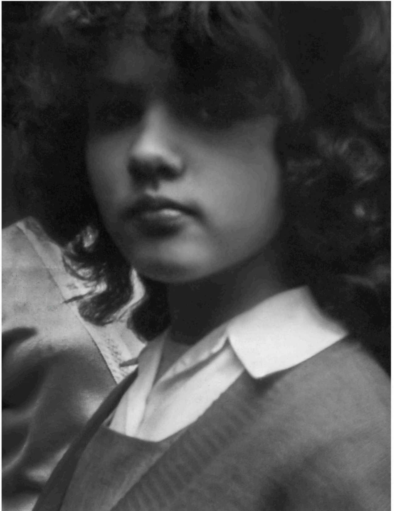
GS en blanco y negro